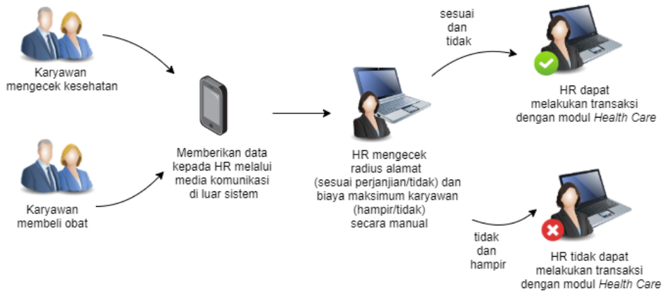
Gambar 2 Alur bisnis baru di PT Jojonomic Indonesia

Kajian yang dibahas adalah membuat dan mengembangkan modul Health Care yang merupakan bagian dari sistem JojoLive. Metodologi pengembangan sistem yang digunakan adalah metodologi Scrum. Metodologi Scrum adalah sebuah kerangka kerja di mana orang-orang dapat menyelesaikan permasalahan kompleks yang senantiasa berubah, di mana pada saat bersamaan menghasilkan produk dengan nilai setinggi mungkin secara kreatif dan produktif (Pressman 2010:82). Dengan dirancangnya sistem JojoLive, diharapkan dapat membantu divisi HR ( Human Resources ), divisi keuangan, dan Top Level Management untuk mengontrol pengeluaran di setiap transaksi beserta pencatatannya.