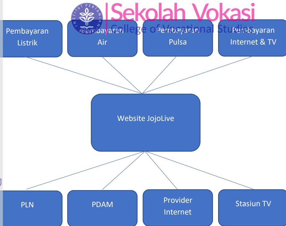
Gambar 2 Proses Bisnis Baru Pembayaran Kebutuhan Perusahaan

website sebagai B2B Super App atau One Stop Shop bagi HR perusahaan. Aplikasi ini dikembangkan untuk memudahkan perusahaan dalam melakukan transaksi pembayaran, pencatatan keuangan, transfer antar bank, kontrol Kesehatan karyawan serta pengambilan keputusan oleh Top Level Management atau C-Level perusahaan seperti Chief Executive Officer (CEO) , Chief Technology Officer (CTO) dan Chief Operating Officer (COO) . Adapun yang dapat dilakukan pada aplikasi website ini yaitu pembelian dan pembayaran kebutuhan perusahaan atau modul Bill Payment seperti pembayaran pulsa, listrik (PLN), air (PDAM), BPJS Kesehatan Karyawan, Internet dan TV Kabel, dan lain-lain serta terdapat modul Direct Transfer Bank yang digunakan perusahaan untuk melakukan transfer antar bank. Selain itu, terdapat modul Health Care untuk mengontrol kesehatan karyawan dengan cara pemenuhan kebutuhan kesehatan karyawan seperti melakukan panggilan dokter, perawat, ataupun obat yang dibutuhkan oleh karyawan yang sakit. JojoLive juga memudahkan Top Level Management dalam melihat pengeluaran perusahaan sehingga dapat mengambil keputusan dan melihat kesehatan keuangan perusahaan dengan melihat analitis dari beberapa chart yang intera.