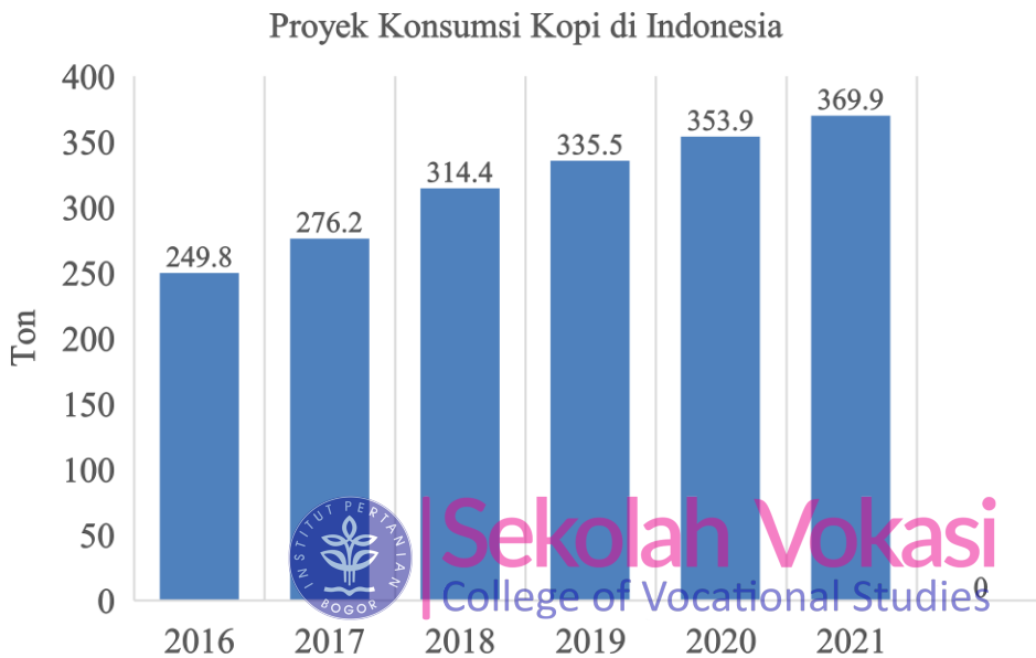
Gambar 2 Data proyeksi konsumsi kopi di Indonesia tahun 2016-2021 Sumber: Kementerian Pertanian dan Katadata.co.id (2018)

Beberapa tahun terakhir, konsumsi kopi di Indonesia mengalami peningkatan yang cukup signifikan. Hal ini disebabkan oleh fenomena munculnya kedai kopi di Indonesia. Pada tahun 2016-2021 diproyeksikan akan mengalami pertumbuhan. Pada data proyeksi ini, setiap tahunnya jumlah penduduk di Indonesia mengalami peningkatan. Dengan demikian, permintaan rumah tangga di Indonesia terhadap kopi akan meningkat juga setiap tahunnya.